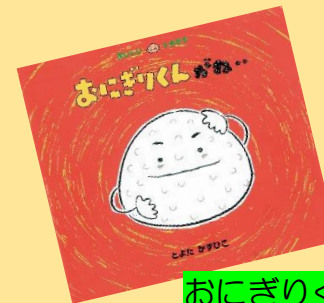
おにぎりくんがね・ とよたかずひこ さく・え

あたたかくなり、出かけたくなる季節となりました そんなとき親子で楽しめる絵本を紹介します★